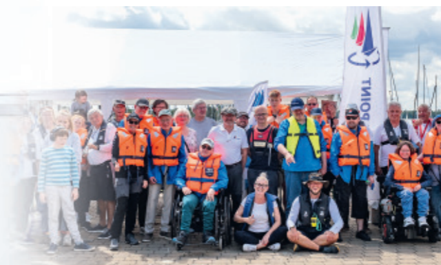
Gruppenfoto beim WENDEKURS am Cospudener See bei Leipzig.